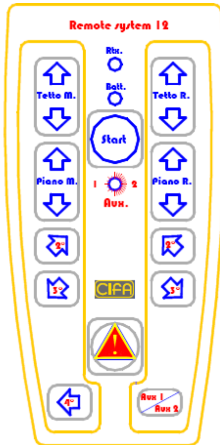
Fig. 1 Trasmettitore